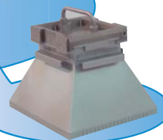
Стойка автоматического управления